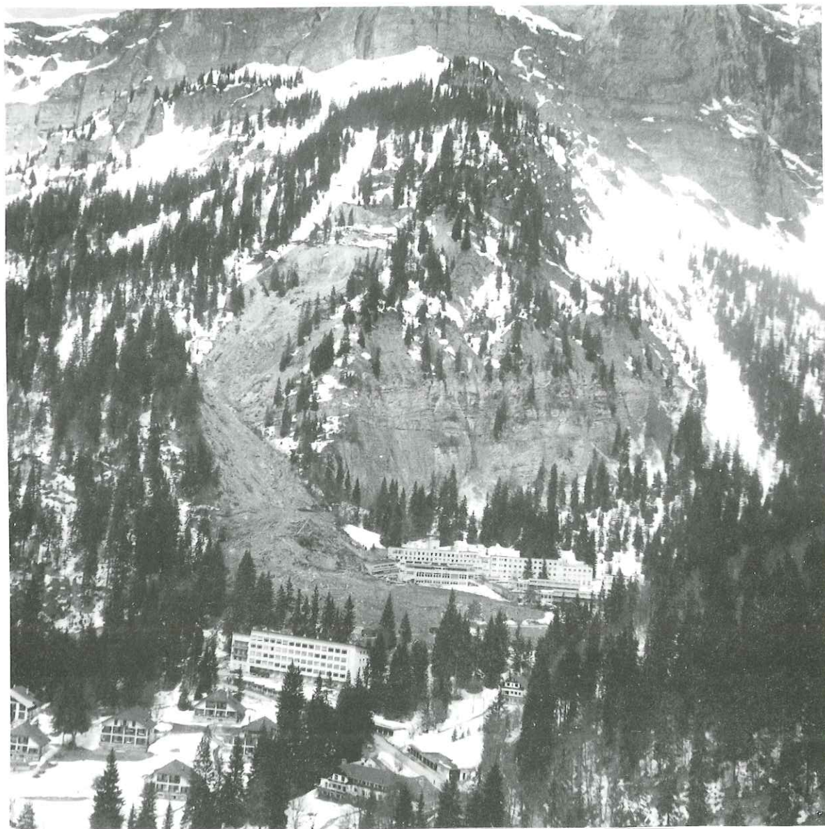
Figure 3: Vue aérienne du glissement.