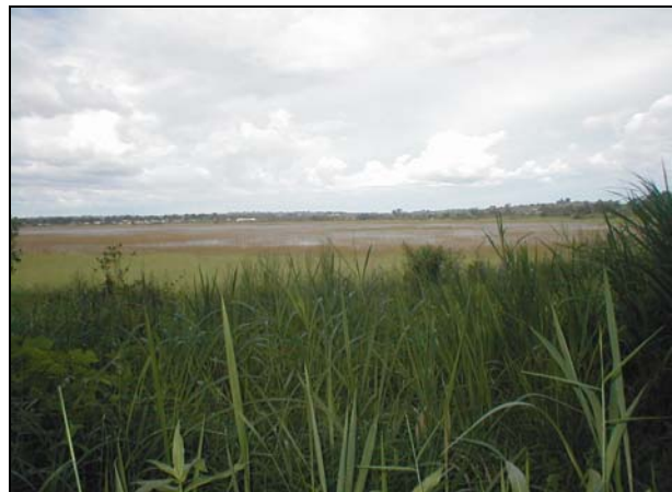
Figure 2 : Lac de Dang marqué par l'envasement et l'eutrophisation (photo Ngounou Ngatcha, octobre 2006).

Le présent travail vise à évaluer l'état de l'envasement de ce lac situé dans la zone de transition entre le Sud du Cameroun humide et le Nord semi-aride. Il s'appuie sur un suivi amorcé en 2004 dans la perspective de développement des recherches sur les régimes hydrologiques et les régimes des éléments dissous et particuliers au niveau des retenues et barrages existants dans le Grand Nord du Cameroun (entre 7° et 12° N).