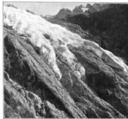
III. — Le Front, vu de la rive gauche.