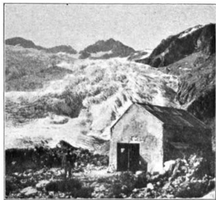
II. — La Chute de Séraes, vue de Tuckett.