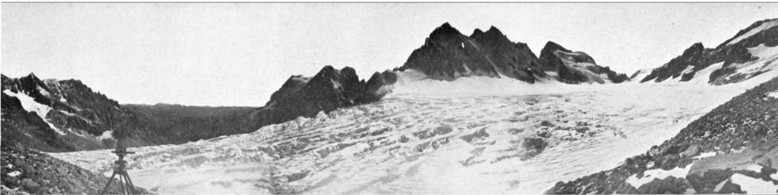
I. — La Région Supérieure.