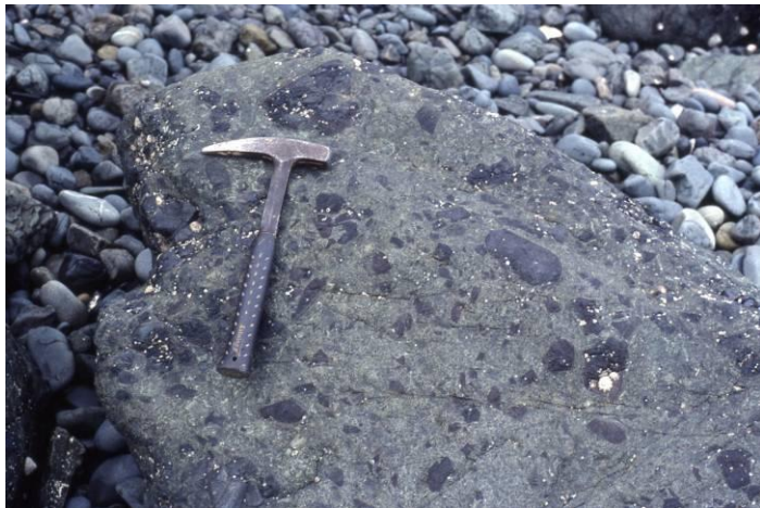
Figure 7. Brèches volcaniques à nombreux fragments anguleux de coussins de lave.

Elles sont abondantes dans la partie nord de la pointe de la Heussaye. Ce sont des roches remarquables par leur couleur et leur structure : au sein d'une matrice de couleur vert foncé, flottent de nombreux éléments anguleux de couleur noire correspondant à des fragments de lave vitrifiée (figure 7). Ces brèches résultent d'éruptions explosives engendrées par la rencontre, à faible profondeur, entre la lave très riche en gaz et l'eau de mer qui s'est vaporisée à son contact. Ces brèches sont connues sous le nom de hyaloclastites.