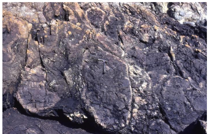
Figure 6. Accumulation de coussins de lave au sein d'une coulée basaltique.