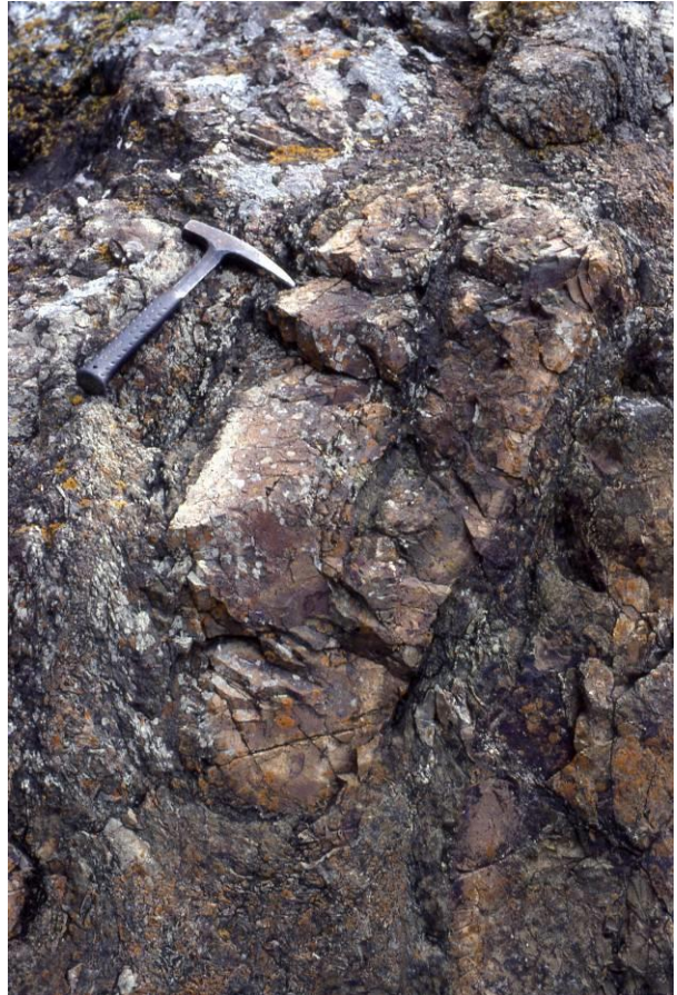
Figure 5. Coussin de lave de taille métrique, vu en coupe, montrant une dissymétrie morphologique.

La taille des coussins varie de 0,2 à 2 m (figures 5 et 6). De nombreux coussins montrent une auréole externe à caractère variolitique. Les varioles sont des globules de 1 à 5 mm de diamètre constitués par des microcristaux de plagioclase. Ces varioles sont interprétées comme des structures de dévitrification.