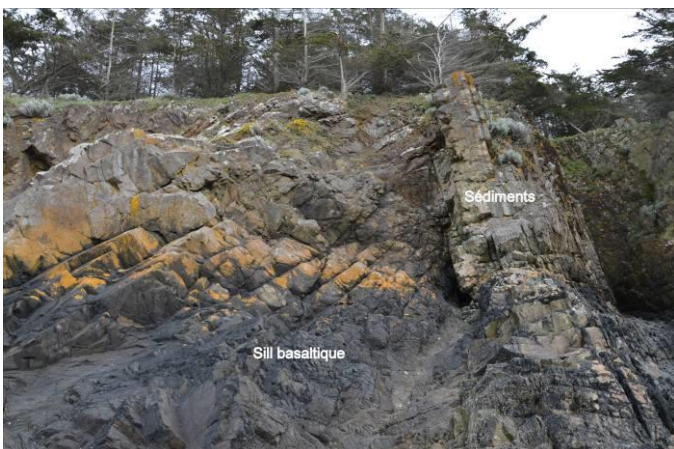
Figure 3. Filon basaltique venu s'injecter dans les séries sédimentaires sous forme de sill.

À la partie inférieure de la séquence, d'épaisses lames, homogènes, à débit massif, affleurent au sein des sédiments qui sont métamorphisés à leur contact. Ce métamorphisme, sur quelques décimètres, transforme les sédiments en cornéennes, roches massives, dures, résistantes à l'érosion et apparaissant en relief sur l'estran. Ces sills sont des roches hypovolcaniques (figure 4).