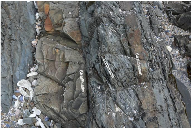
Figure 3. Stratification et schistosité dans les roches sédimentaires de la pointe de la Heussaye.