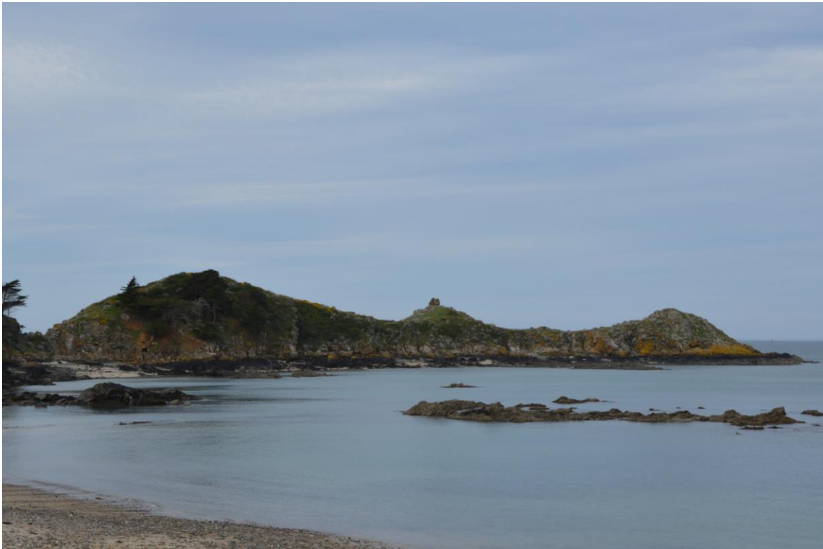
Figure 1. La pointe de la Heussaye s'avancant dans la mer, vue du côté est.

Barrois leva la carte géologique à 1/80 000 de cette région (feuille de Saint-Brieuc, n° 59) et publia une première description détaillée des divers faciès en 1932. Il fallut attendre la thèse de Bernard Auvray (1967) pour une étude moderne des volcanites ; il cartographia en détail la séquence volcanique. De nombreux chercheurs français et étrangers ont poursuivi l'étude de cette série.