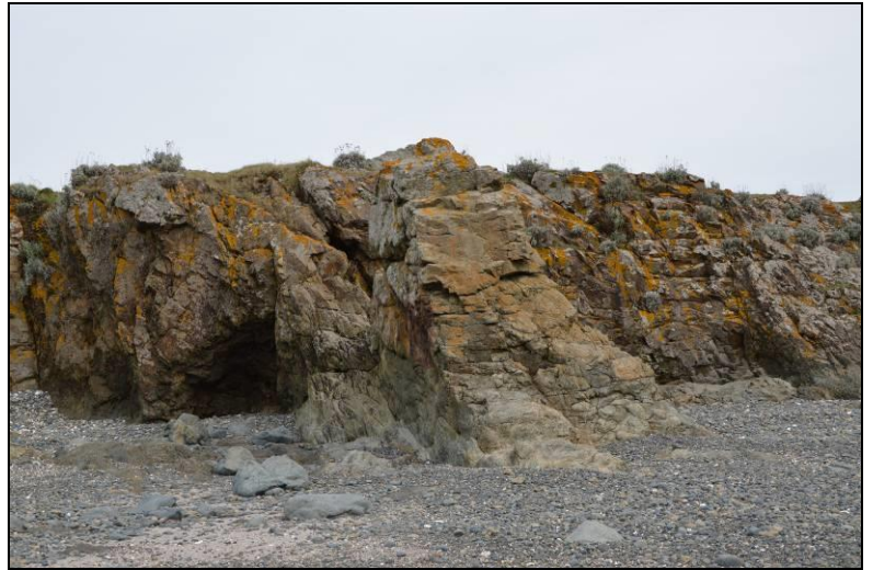
Figure 8. Filon acide venu s'injecter dans les formations volcaniques et mis en relief par l'érosion.

Ces roches constituant les termes ultimes du volcanisme, aphanitiques, à texture trachytique sont connues sous le nom de kératophyres (figure 8).