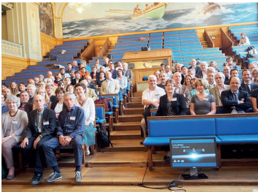
Figure 1. Photographie des participants dans l'amphithéâtre de la Maison des océans et de la biodiversité.

Du 8 au 10 juin 2016, 70 scientifiques français et 30 américains se sont retrouvés à l'Institut d'océanographie à Paris (figure 1) pour célébrer les 10 ans d'activité de la mission spatiale Calipso . Ces trois jours ont permis d'organiser une demi-journée pour évoquer les grandes étapes du projet, ainsi qu'un atelier de travail sur les thèmes de prédilection des chercheurs impliqués dans l'exploitation de la mission : les sources, transport et transformation des aérosols, la microphysique des nuages, les relations entre les nuages et le climat, le bilan radiatif du système Terre, l'étude des régions polaires, ainsi que les synergies instrumentales avec d'autres missions ou bien les retombées sur les produits opérationnels. La session aérosol a permis des discussions sur l'apport des mesures Calipso sur la caractérisation du dépôt des poussières désertiques sur les écosystèmes, sur le transport des aérosols de feu de forêt et sur la variabilité interannuelle des aérosols stratosphériques (figure 2). Dans la session nuage/climat, les questions discutées ont été l'apport sur