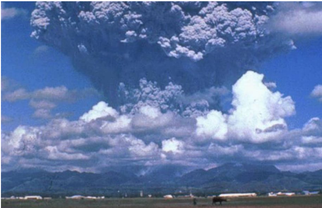
Photo du nuage de cendres et de soufre s'échappant du Mont Pinatubo (Philippines), le 12 juin 1991, trois jours avant son éruption. Le volcan avait été inactif durant les 500 années précédentes.

Directeur de recherche au CNRS, laboratoire LATMOS, Institut Pierre Simon Laplace (IPSL), Sorbonne Université