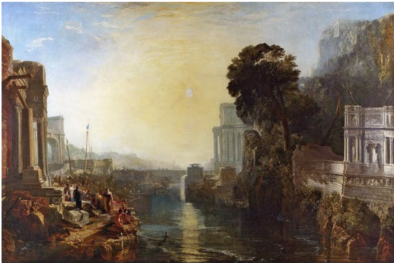
L'Ascension de l'Empire carthaginois de William Turner (1815).