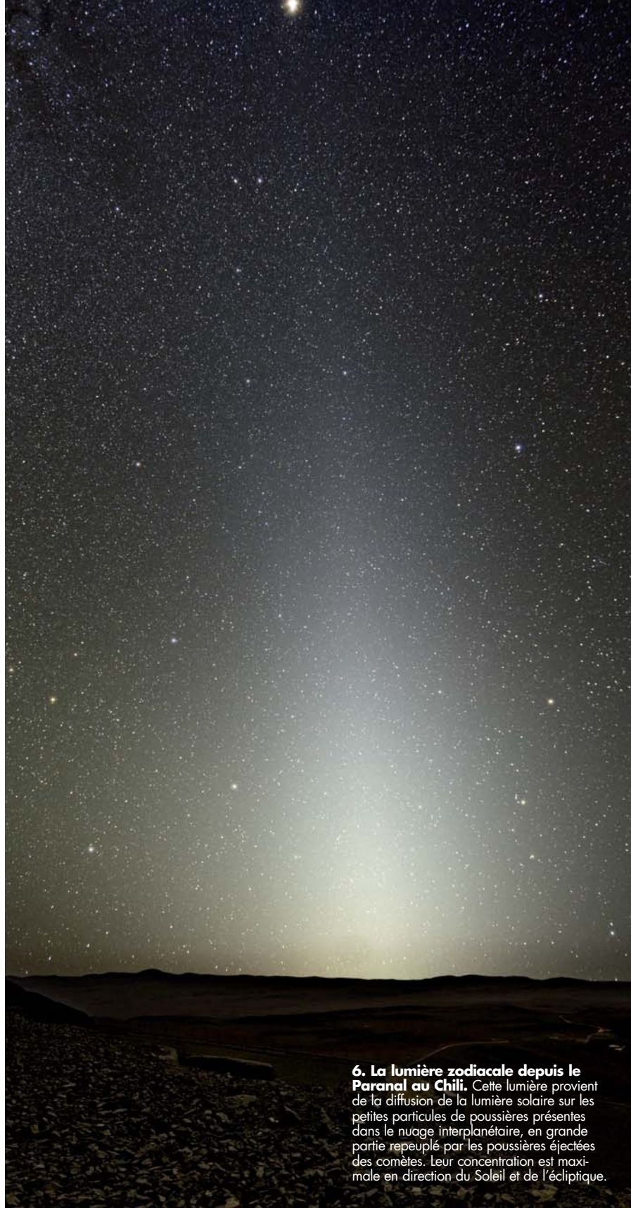
6. La lumière zodiacale depuis le Paranal au Chili. Cette lumière provient de la diffusion de la lumière solaire sur les petites particules de poussières présentes dans le nuage interplanétaire, en grande partie repeuplé par les poussières éjectées des comètes. Leur concentration est maximale en direction du Soleil et de l'écliptique.