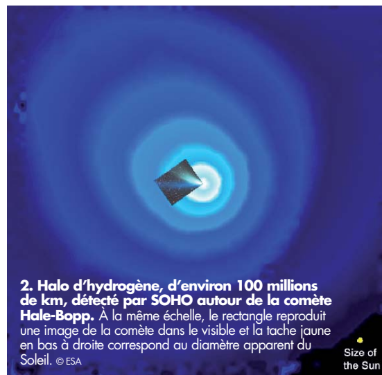
2. Halo d'hydrogène, d'environ 100 millions de km, détecté par SOHO autour de la comète Hale-Bopp. À la même échelle, le rectangle reproduit une image de la comète dans le visible et la tache jaune en bas à droite correspond au diamètre apparent du Soleil.

Le taux de production en eau des comètes se déduit de telles observations. Il varie de quelque 3 kg/s pour une comète peu active à environ 300 t/s pour une comète extrêmement active comme C/1995 O1 Hale-Bopp. Des images spectaculaires du halo d'hydrogène de cette belle comète ont été obtenues par le satellite SOHO (SOlar and Heliospheric Observatory), alors qu'elle passait dans le Système solaire interne en 1996-1997 (fig. 2). Les taux de production en eau impliquent qu'une comète brillante, dont le noyau a une taille d'environ 10 km,