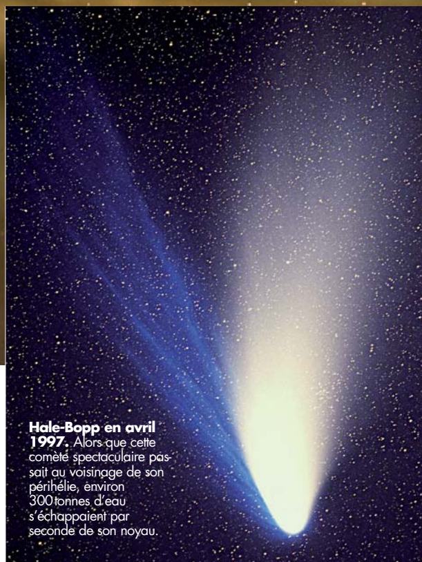
Hale-Bopp en avril 1997. Alors que cette comète spectaculaire passait au voisinage de son périhélie, environ 300 tonnes d'eau s'échappaient par seconde de son noyau.

Les belles comètes ont de tout temps frappé les imaginations, même si leurs propriétés sont longtemps restées accessibles. L'étude de leurs orbites, initialisée par Edmund Halley au XVII e siècle, a montré qu'elles décrivent autour du Soleil des ellipses, susceptibles d'être très allongées et fortement inclinées par rapport à l'écliptique. Les progrès de l'astrophysique ont, au milieu du XX e siècle, permis de concevoir qu'elles sont essentiellement constituées d'un noyau solide de glaces et de poussières. Lorsqu'il se rapproche du Soleil, des glaces se vaporisent partiellement sur son côté ensoleillé ; pour la glace d'eau dans le vide interplanétaire, la sublimation se produit à une température supérieure à -70^{\circ} , atteinte dès que la distance au Soleil est inférieure à quelque 3 unités astronomiques (ua). Ce sont d'ailleurs les faibles modifications orbitales non gravitationnelles, induites par l'éjection de matière du côté ensoleillé des noyaux, qui ont permis à l'astronome américain Fred Whipple de prédire leur existence en 1950 et de les qualifier d'énormes boules de neige sale.