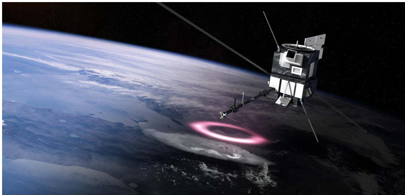
Illustration du satellite Taranis en train d'observer des elfes.