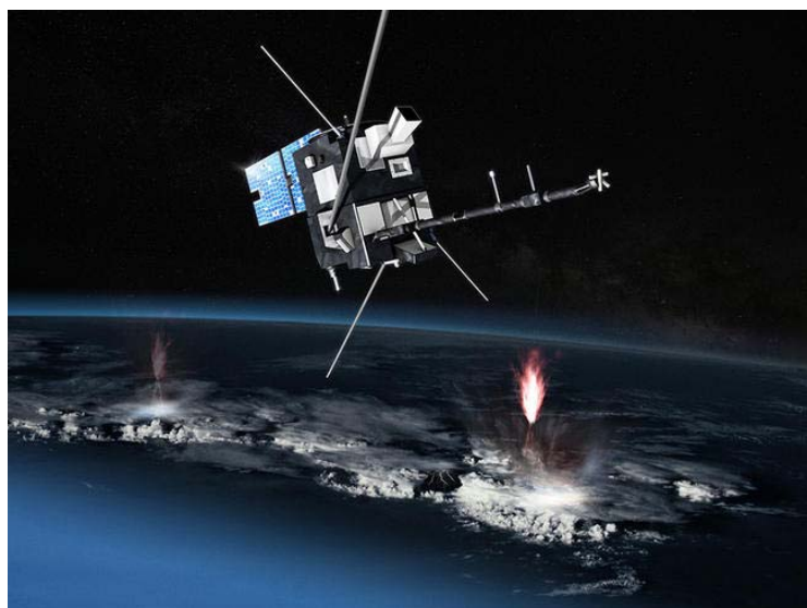
Illustration du satellite Taranis - Sprite TARANIS (Tool for the Analysis of RAdiations from light NIngs and Sprites) est un projet microsattellite, du programme Myriade du Cnes, dédié à l'étude des transferts impulsifs d'énergie entre l'atmosphère et l'environnement spatial de la Terre qui sont observés au-dessus des régions orageuses.

À raison de quatorze orbites terrestres quotidiennes, Taranis sera en mesure d'identifier chaque jour des centaines d'événements liés à des transferts impulsifs d'énergie tout en enregistrant leurs données physiques et le contexte dans lequel ils se produisent. À l'issue de la mission, qui devrait s'achever fin 2024, le satellite aura ainsi accumulé une masse d'informations sans précédent sur les phénomènes lumineux transitoires et les flashes de rayons gamma terrestres.