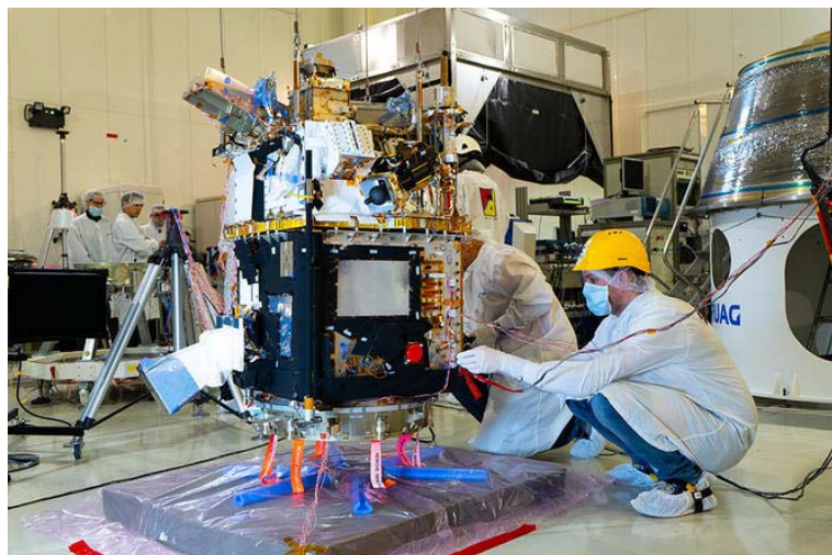
Derniers tests interface lanceur du satellite Taranis en salle blanche au Centre spatial de Toulouse.

En venant se positionner à plusieurs centaines de kilomètres au-dessus des nuages, Taranis va donc pouvoir collecter des données beaucoup plus précises et complètes sur tous ces phénomènes. Pour mieux percer les mystères qui les entourent, ce microsatellite de 180 kg regroupe six expériences scientifiques distinctes 3 . Constituée de deux caméras associées à quatre photomètres, l'expérience MCP (MicroCameras et Photomètres) sera entièrement dédiée à la caractérisation des TLE selon la longueur d'onde de leur spectre lumineux et à celle des orages qui leur donnent naissance.