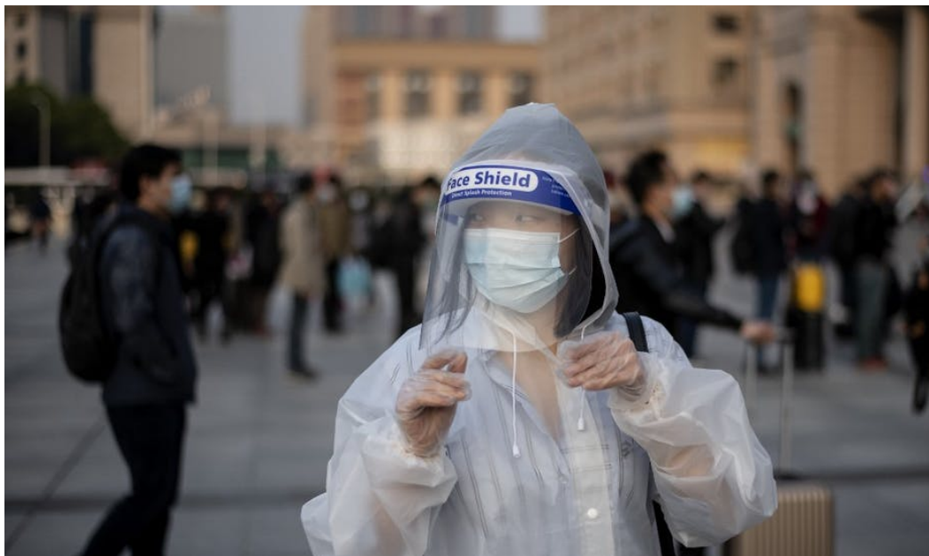
Début avril 2020, à Wuhan (Chine).

Directrice de recherche au CNRS, laboratoire LATMOS, Institut Pierre Simon Laplace (IPSL), Sorbonne Université