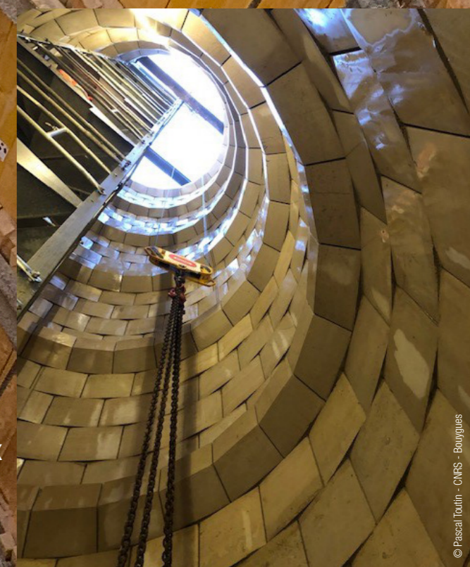
Vue de l'intérieur du puits une fois terminé. On distingue les claveaux en pierre maçonnée.