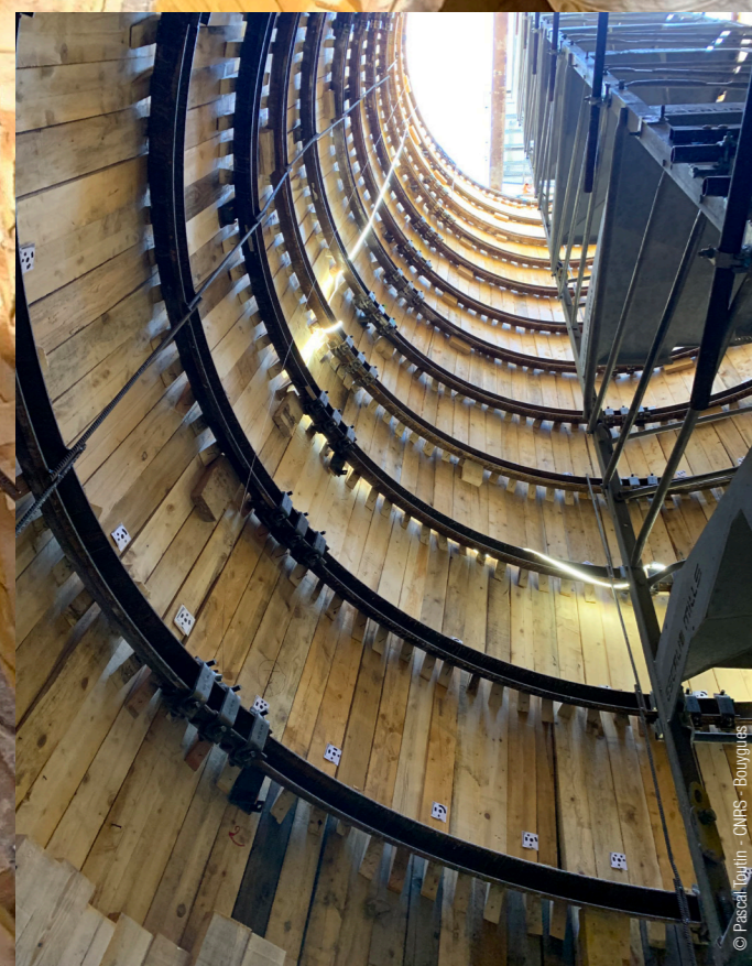
Vue en contre plongée du puits avec l'escalier d'accès à droite. Une fois creusé, le puits a été habillé d'un parement en bois temporaire.