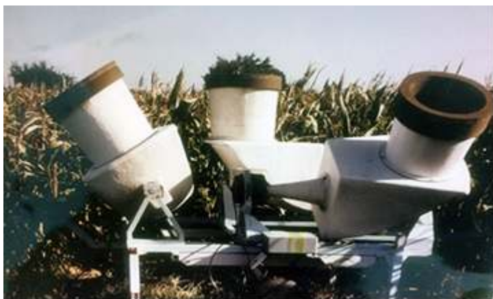
Photographie 3. Le minisodar Doppler trois antennes, 6 kHz du CRPE : les trois antennes monostatiques sont fixées sur un chariot de remorque. On remarque au premier plan à droite la chambre de compression avec un cornet exponentiel pour envoyer les impulsions sur un tronc de parabole : le faisceau central du signal d'émission-réception en sortie est parallèle aux axes des cylindres.